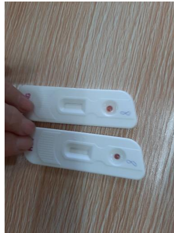
Элэгний В, С вирус илрүүлэх шинжилгээ хийж буй нь

3. АНУ-ын Мичиганы их сургуулийн оюутан Б.Саруул тус сургуулийн 10, 11-р ангийн суралцагчдад АНУ-д хэрхэн суралцах талаар зөвлөгөө мэдээллийг өөрийн туршлагаасаа хуваалцан, арга барил, зөвлөмжийг өглөө.