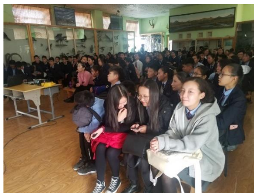
10, 11-р ангийн 170 гаруй суралцагчид оролцлоо

2. Мөн тус сургуулийн 15 настангуудын судалгаа гаргаж 10, 11-р ангийн 70 гаруй суралцагчдыг графикт вакцинд хамруулж, мөн элэгний В, С вирусг илрүүлэх шинжилгээнд хамрууллаа. В вирусээр халдвар тээгч суралцагч илрээгүй бөгөөд энэ төрлийн вирусээс хамгаалах вакцинд шинжилгээ өгснөөс хойш 30 хоногийн хугацаанд хамрагдахыг зөвлөлөө.